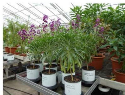
Wachstumsvergleich in TerraBoGa Erde (unten) und Kontrollversuch in herkömmlichem Substrat (oben)