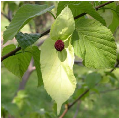
Taschentuchbaum ( Davidia involucrata )